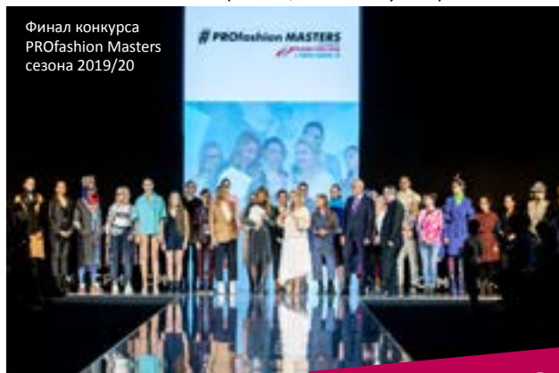
Финал конкурса PROfashion Masters сезона 2019/20