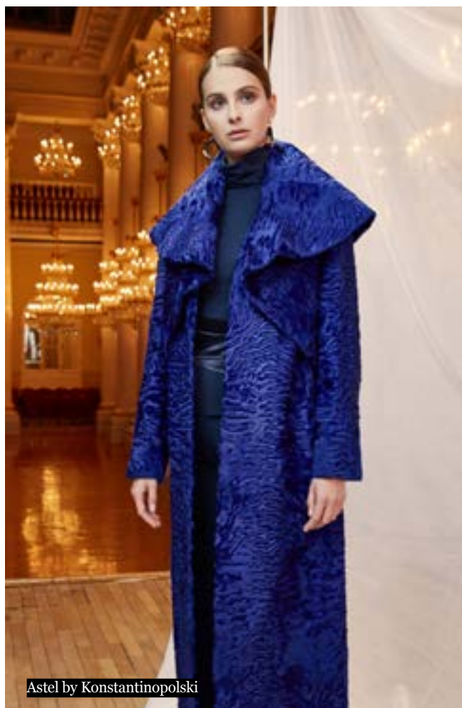
Astel by Konstantinopolski

За последние несколько лет рынок изделий из меха претерпел тектонические изменения. В 2016 году эта группа товара в числе первых подверглась обязательной маркировке, оборот некоторых компаний обесился, но ряд игроков ушел с рынка. Кроме того, российских производителей серьезно потеснили